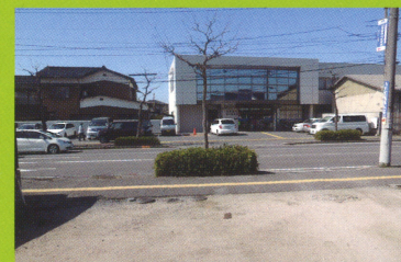
向かいの鳥取銀行