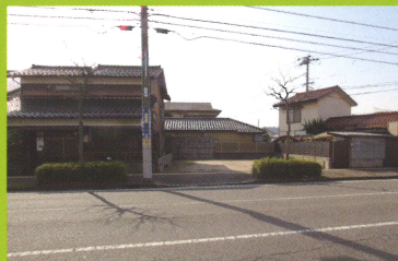
幹線道路沿いの好立地