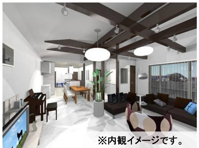
※内観イメージです。

見学時間のご予約・お問合せは、当社営業担当者又は 下記電話番号までご連絡を下さい。