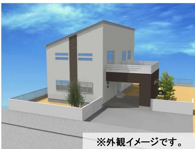
※外観イメージです。